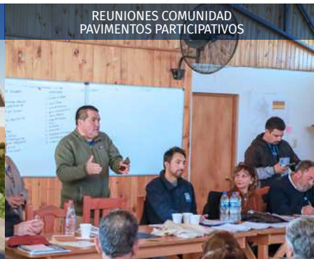
REUNIONES COMUNIDAD PAVIMENTOS PARTICIPATIVOS