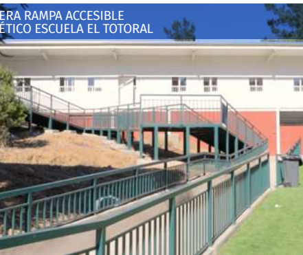
ERA RAMPA ACCESIBLE ETICO ESCUELA EL TOTORAL

Obtención de financiamiento de los proyectos “Mejoramiento Gimnasio Municipal” por un monto de $124.983.607 y “Mejoramiento Calle José Narciso Aguirre” con una inversión de $115.643.839 en la línea de financiamiento de SUBDERE.