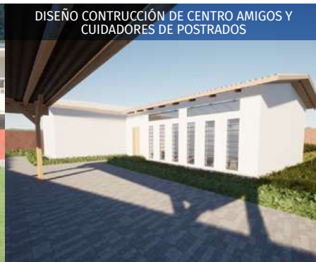
DISEÑO CONTRUCCIÓN DE CENTRO AMIGOS Y CUIDADORES DE POSTRADOS