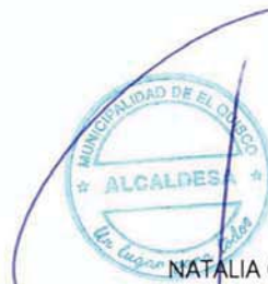
NATALIA CARRASCO PIZARRO ALCALDESA

Distribución: RENTAS ARCHIVO NCP/MCM/VRP