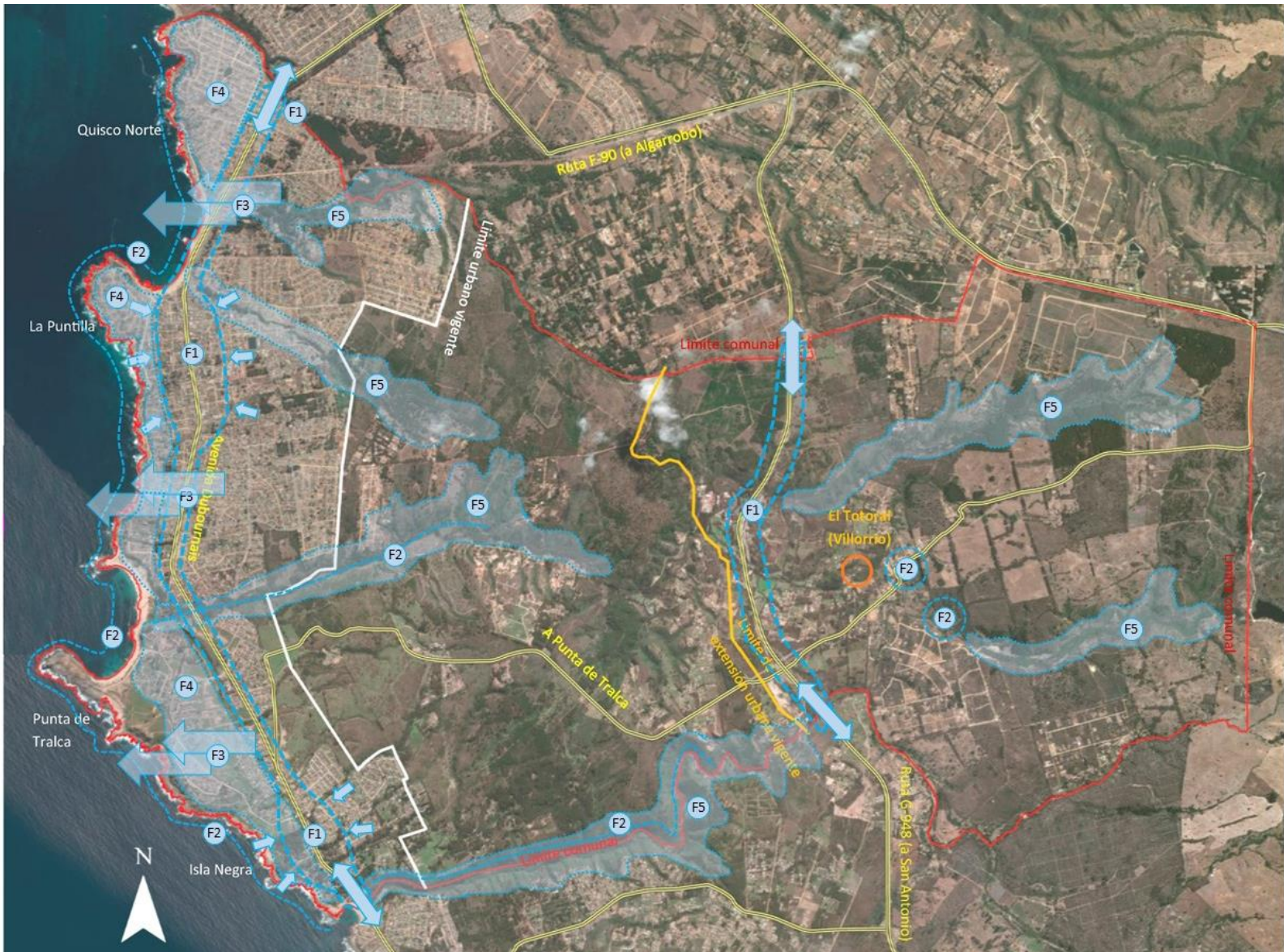
Figura IV-1 Áreas de Influencia de fortalezas y oportunidades a escala comunal.